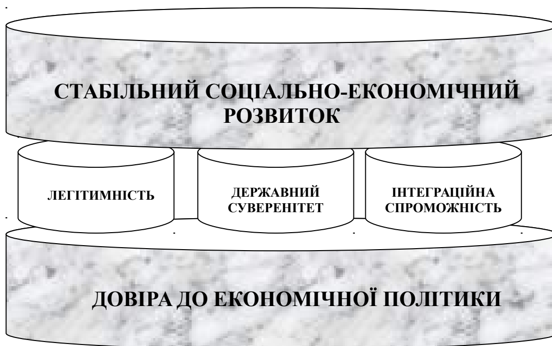
Рисунок 1. Роль довіри до економічної політики уряду в забезпеченні стабільного функціонування господарської системи

Триєдність інститутів державної влади ґрунтується на механізмі забезпечення державного суверенітету, забезпечення легітимності (та відповідальності) та інтегративної спроможності держави (рис. 1).