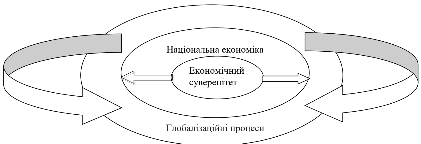
Рисунок 1. Місце економічного суверенітету в економічному розвитку та економічній безпеці країни

Важливим при розробці та формуванні системи інститутів є те, що механічне копіювання позитивного досвіду інших країн майже ніколи не було успішним. Це пов'язано з тим, що копіюються конкретні успішні інститути, які носять ефективний характер в одній ситуації, але мають зовсім непередбачувані наслідки за інших умов. Потрібно проектування нових інститутів, які виконують ті ж функції, але сумісні з особливостями національного соціального та культурного середовища і не суперечать неформальним інститутам. Виклики розвитку сучасного світу вимагають теоретичного обґрунтування основних напрямів і пріоритетів державної економічної політики за рахунок осмислення та розуміння особливої ролі держави як системоутворюючого інституту та форм його участі в ефективній реалізації економічного потенціалу зростання національної конкурентоспроможності та соціально орієнованого розвитку.